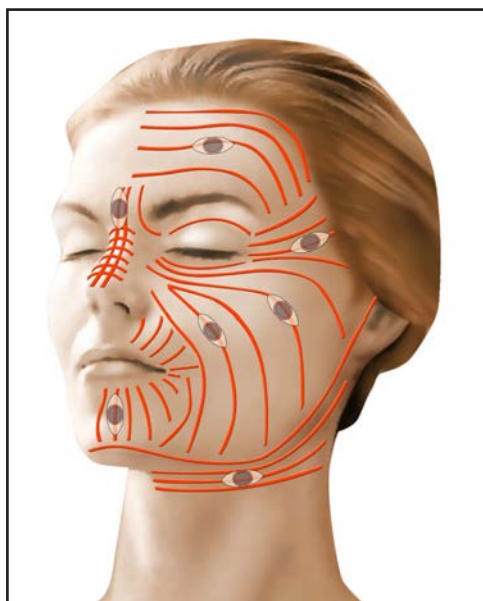
lignes de moindre tension de la face - orientation optimale des fuseaux d'excision

Souvent, il est nécessaire d'avoir recours à un tracé d'incision spécial visant à « briser » l'axe principal de la cicatrice initiale, à réorienter au mieux la cicatrice en fonction des lignes de tension naturelles de la peau, et à diminuer ainsi la tension exercée sur les berges de la plaie.